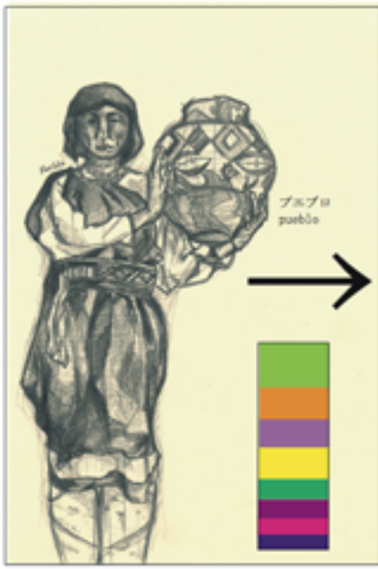
米国南西部の石やレンガ造りの集団住宅に住む民族